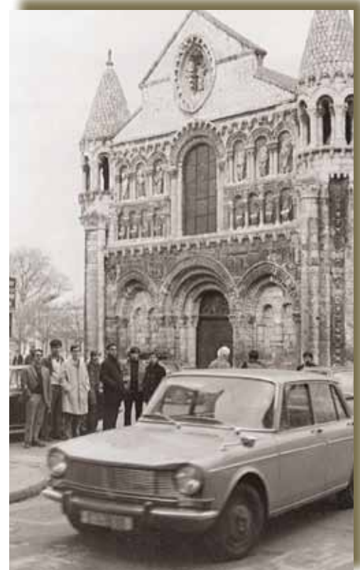
Viaje de estudios Preu. 1970

Si tienes fotos o videos que quieras compartir e incluir en el archivo de la Asociación ponte en contacto con nosotros en el email comunicacion@aacolegioinmaculada.es