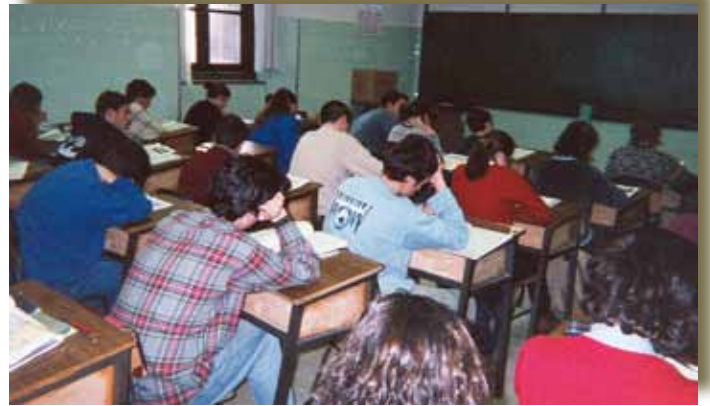
Estudio en aula, años 90