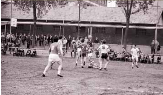
Fiestas Colegiales, 1980