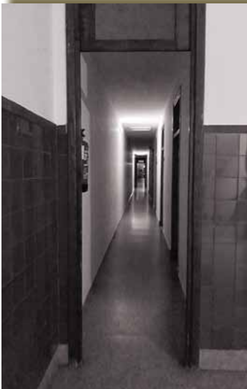
Pasillo de la muerte

Si tienes fotos o videos que quieras compartir e incluir en el archivo de la Asociación ponte en contacto con nosotros en el email comunicacion@aacolegioinmaculada.es