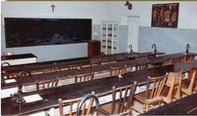
Aula escalonada de Ciencias Naturales, años 70