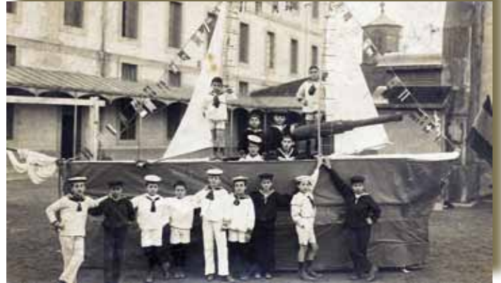
Fiestas Rectorales hace 100 años (1919)