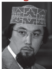
Imam Yahya Pallavicini Presidente de Comunità Religiosa Islamica Italiana